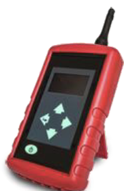
Signaal analyzer voor een spotmeting van het 2G, 4G of 5G netwerk.

De meting wordt uitgevoerd door een telecom engineer. Voor deze meting maakt hij gebruik van diverse meetinstrumenten.