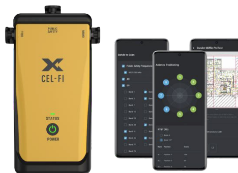
Nextivity Compass XR voor een continue loopmeting van het 4G en 5G netwerk.